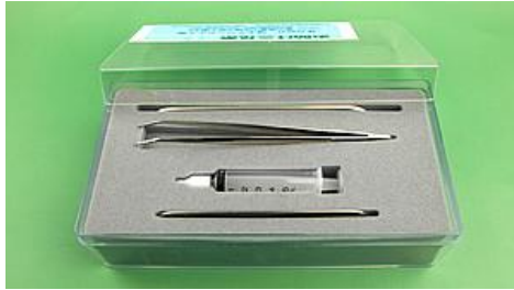
【お助け三兄弟】 価格 10,500円(税込)