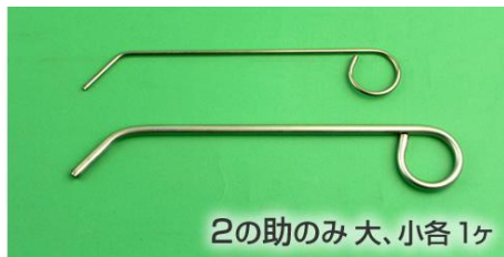
2の助のみ 大、小各1ヶ